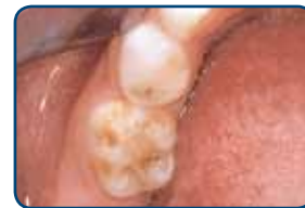
Een kaaskies in een melkgebit

Kaaskiezen zijn kiezen met plekken waarvan het glazuur minder hard is. Deze plekken zijn herkenbaar aan de geelbruine verkleuringen. Meestal treden ze op bij de eerste grote kiezen (zie foto's). De afwijking kan zich beperken tot enkele plekkjes, maar ook kan een heel vlak worden aangetast. In kaaskiezen ontstaan vaak gaatjes. Ook kunnen ze snel afbrokkelen door slijtage. Ze zijn vaak gevoelig voor koud en warm en ook zoetigheid doet vaak zeer. Kinderen met kaaskiezen vermijden daarom wel vaker zoetigheden. Denk je dat je kind last heeft van kaaskiezen? Neem dan contact op met je tandarts.