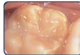
Een kaaskies in een blijvend gebit