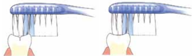
Tandenborstel komt niet in de groef

Zowel melkkiezen als blijvende kiezen hebben veel groefjes op het kauwvlak. Daarin ontstaat gemakkelijk tandplak. Niet regelmatig verwijderde tandplak kan gaatjes veroorzaken. Goed poetsen dus! Om het kauwvlak goed te beschermen, kan de tandarts een laagje 'kunsthars' (sealant) aanbrengen. Dit heet 'sealen'. Diepe groeven kan hij door het sealen afdichten. Alleen de blijvende kiezen komen hier normaal gesproken voor in aanmerking, meestal kort nadat ze helemaal zijn doorgebroken. De tandarts zal alleen sealen als hij verwacht dat er gaatjes in de groefjes ontstaan. Ook gesealde kiezen moet je goed poetsen.