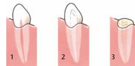
Het wortelkanaal van de tand (1) wordt voorbehandeld (2), de tand wordt afgeslepen en gevuld (3)

Vóórdát de tandarts uw kunstgebit in uw mond kan plaatsen, moet hij nog twee dingen doen. Eerst slijpt hij de tanden en kiezen, die als pijlers voor de overkappingsprothese gaan fungeren, tot net boven het tandvlees af. Alleen de wortel van zo'n tand of kies blijft dus over. Het voorbehandelde kanaal sluit hij af met een vulling. Dan trekt uw tandarts de overige tanden die in uw mond zijn blijven staan. Direct daarop aansluitend plaatst hij de overkappingsprothese. U hoeft dus niet bang te zijn dat u enige tijd zonder tanden zult rondlopen.