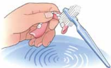
Reinig uw prothese na iedere maaltijd

Etenresten aan de binnen- en buitenzijde van de overkappingsprothese kunt u het beste verwijderen met behulp van een speciale protheseborstel, bijvoorbeeld van Lactona of Oral-B, en water. Gebruik géén tandpasta. Die kan te veel schuren. Een schoon kunstgebit voelt altijd glad aan. Laat uw gladde gebit tijdens het reinigen niet uit uw handen glijpen. Het zal kapot gaan. Vul voor de zekerheid eerst de wasbak met water en reinig uw kunstgebit daarboven.