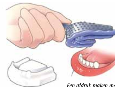
Een afdruk maken met een afdruklepel

Een afdruk van uw kaak wordt gemaakt met behulp van een afdruklepel, gevuld met een speciaal afdruk-materiaal. In het tandtechnisch laboratorium wordt die afdruk met gips gevuld. Hierdoor ontstaat een gipsmodel. Hierop wordt een goed passende afdruklepel van kunsthars gemaakt. Met deze lepel wordt nóg een afdruk gemaakt om een nóg nauwkeuriger gipsmodel te krijgen. Hierop wordt uw overkappingsprothese gemaakt.